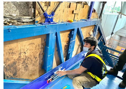
Trabajos de nivelado de precisión de soportes en estructuras en Johor Bahru (Malasia)