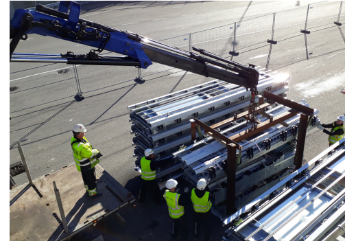
Trabajos de descarga de pasillo en el Aeropuerto de Oslo (Noruega)