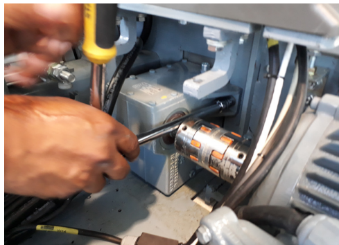
Ajuste y alineado de acoplamiento motor-eje en el Aeropuerto de Tocumen (Panamá)