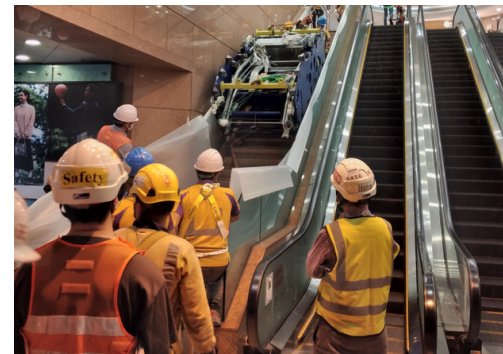
Trabajos de introducción de cabeza de escalera mecánica en C.C. Telford Garden (Hong Kong)