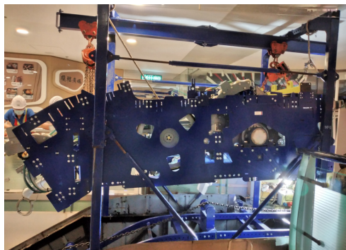
Izado en pórticos de módulo en estructura antigua en Telford Garden (Hong Kong)