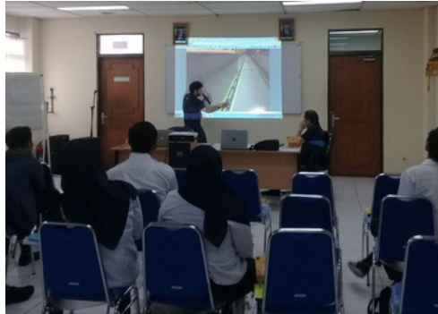
Impartición de un curso de funcionamiento y mantenimiento en Denpasar (Indonesia)